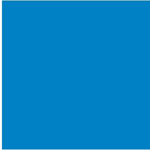
MAR / NEGRO 6498 ancho width 300 cm 6497 ancho width 250 cm